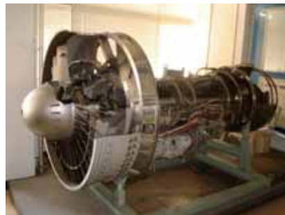
図2 製図室に展示されているFJR710のカットモデル 当時も今も日本の技術は世界を驚かせている。