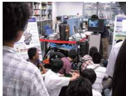
機械情報工学科でロボットの研究を行っている研究室を見学する高校生たち

経営戦略学専攻修士1年）の講義。留学生の立場から工学部はほかの学科と比べても留学生の数が多く、多文化交流する機会に恵まれていることを力説しました。高校生は楽しそうな国際交流の写真などを見て、大学へ入学することへの期待を膨らませたと思います。