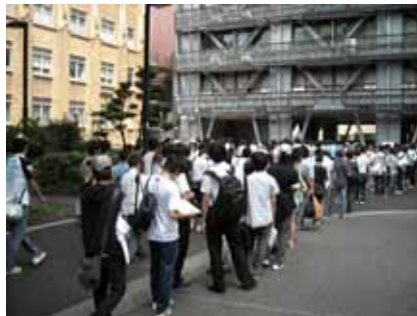
工学部8号館に集まった高校生たち

聴講して下さり、とても楽しく講義ができました。講義の後には、地震予知の可能性や建築学科卒業後の進路など様々な質問をして頂き、高校生と大学教員の直接交流の場として有意義であったと思います。高齢化していく社会を背負っていく若い世代ですが、大変頼もしく感じました。」とおっしゃっていました。