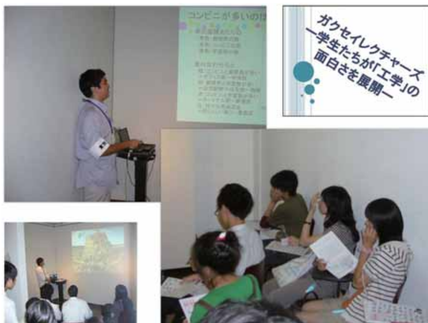
熱心に講義をする大学生とそれを聞く高校生たち