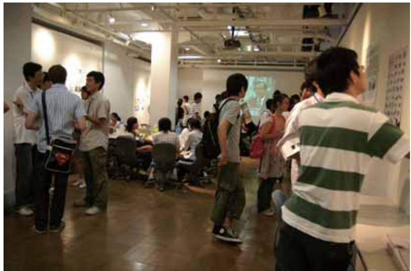
学生だんわ室で高校生が工学部生に様々なことを聞いている様子

さらに、工学部生が進路に悩んでいる高校生にアドバイスする部屋「学生だんわ室」を設け、多くの高校生が質問に来